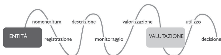
Fig. 5 - Il percorso della valutazione e decisione (Monitor, 2008).

Cislaghi e Braga (2008) propongono la valutazione come un percorso, che nasce con la nomenclatura e termina con una decisione (Fig. 5). Fasi antecedenti e necessarie alla valutazione sono la descrizione e il monitoraggio: la descrizione è una copia semplificata della realtà, anche se, essendo una copia, può esserne distorta; il monitoraggio rende la descrizione sistematica e ripetuta accompagnata da un confronto. Uno degli elementi essenziali affinché la descrizione si trasformi in una valutazione, è la presenza della variabilità nel fenomeno osservato.