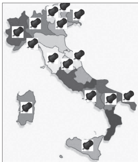
Fig. 1 - Le regioni e province autonome intervistate.

po in cui era presente sia lo staff che l'assessore e/o il direttore generale, in alcune regioni sono stati intervistati solo gli assessori o i direttori generali ed infine in alcuni casi in cui si è intervistato solo lo staff del dipartimento della Salute (Fig. 2).